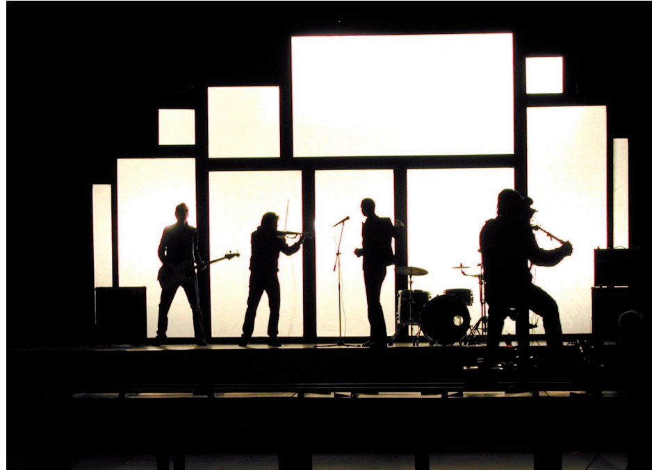
SVĚTLO A STÍN. Nejnovější klip skupiny O5&Radeček má podobu stínohry.

Nejtěžší bylo postavit konstrukci o rozměrech pětkrát osm metrů. Na její přípravě i stavbě spolupracovali desítky lidí včetně studentů brněnské techniky, kteří namalovali projekt. O výrobu se