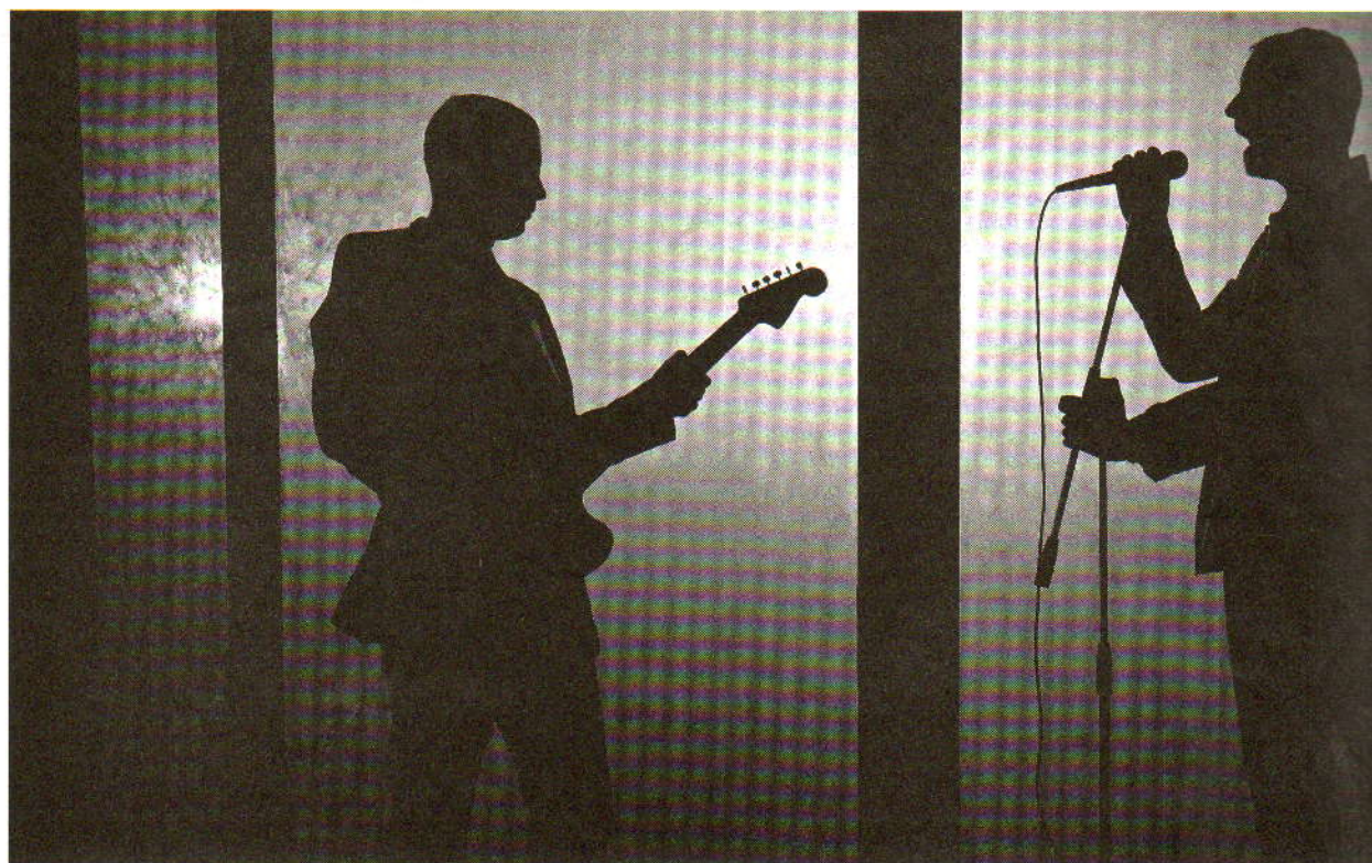
STÍNOHRA. Jeden z prvních záběrů z nového klipu, který uvede singl Máš mě na svědomí.